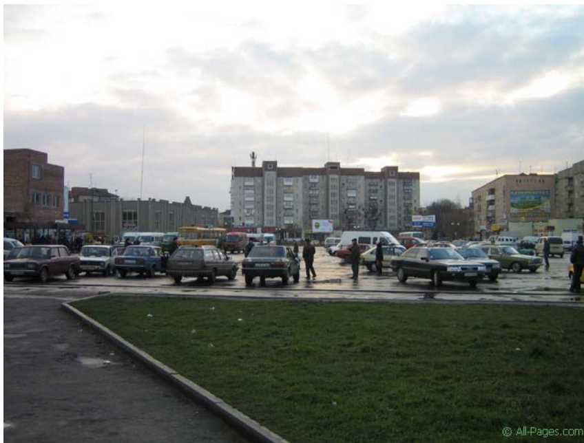
Привокзальная площадь города Ковеля. Современная фотография с сайта http://all-pages.com/city_photo/6/9/49/131/11.html